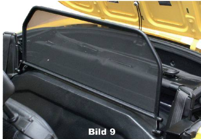
Bild 9 Windschott in Position stellen! Untere Rahmenstange (Windschott) auf die Plastikabdeckung aufstellen! FERTIG!